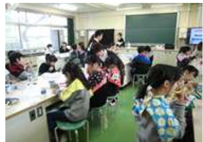
〈歯みがき指導の様子〉

昨年度に続き、三重県歯科衛生士会松阪支部の歯科衛生士さん4人に来ていただき、5年生対象に染め出しを行いながら効果的な歯みがきの仕方を教えていただきました。第四小学校では、学校保健計画重点目標に「口腔の健康」を据え、取組を進めています。