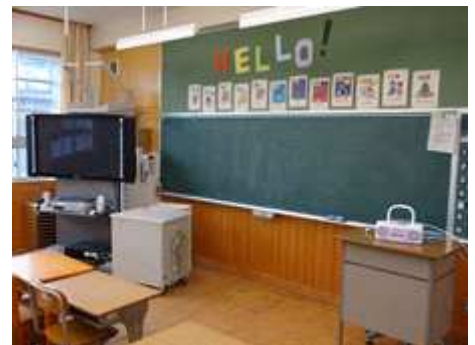
〈外国語活動ルーム〉

平成32年度から完全実施される新しい学習指導要領のうち、一部が来年度から実施されます。来年4月からの円滑な実施に向け、後期から試験的に3年生以上の学年で、のびっこタイムの時間に隔週で外国語活動を追加実施します。今年度は、少人数教室を1室、外国語活動ルームとして整備しました。また、ipadを班別に活用し、課題を解決する学習にも取り組み始めたところです。ご理解ご協力をよろしくお願い致します。