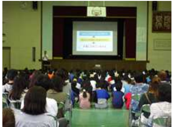
〈親子人権学習会の様子〉