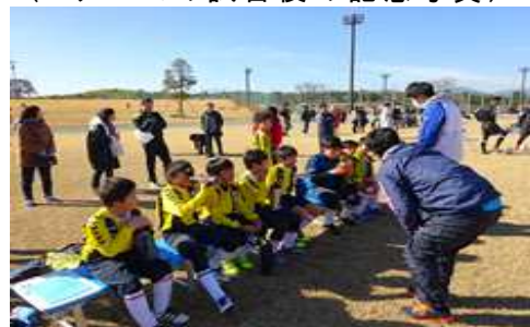
(Bチームのハーフタイムの様子)