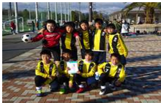
(Aチームの試合後の記念写真)