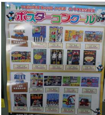
(本校児童の作品も掲載されている ポスターコンクール県内の優秀作品)

全校集会で、作品募集や各種大会でいただいた賞の伝達表彰を行いました。子どもたちは、意欲的に作品作りに取り組み出品数、入賞数ともにとっても多くなっています。いつも子どもたちには、続けて取り組む事が大切と伝えていきます。