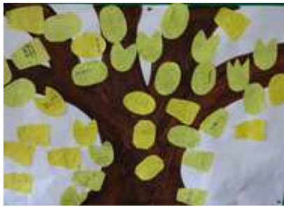
しやうこうぐち ことば き 昇降口のふわふわ言葉の木