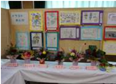
てん じ さく ひん まんが しゅげい 展示作品（イラスト漫画、手芸、フラワーアレンジメント）

ぜんこう い うれ 全校で、言われて嬉しい「ふわふわ言葉」を考えたり、いじめ防止ポスターの作成・掲示を児童会・人権委員会が中心に取り組みました。