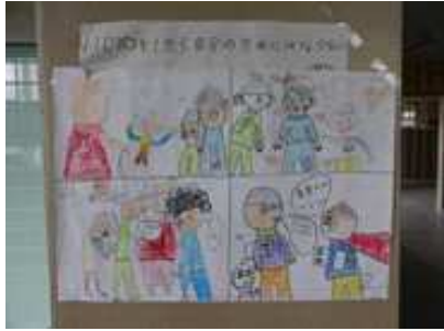
ろうか ぼうし 廊下のいじめ防止ポスター

ぜんこう い うれ 全校で、言われて嬉しい「ふわふわ言葉」を考えたり、いじめ防止ポスターの作成・掲示を児童会・人権委員会が中心に取り組みました。