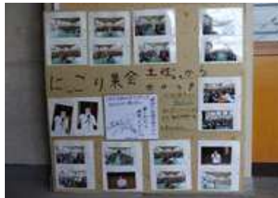
げん かん し や し ん けい じ 玄関に写真とサインを掲示

児童会が主催で、11月10日に土性沙羅さんをお招きしてにっこり集会を開きました。「あきらめない力」を学びました。